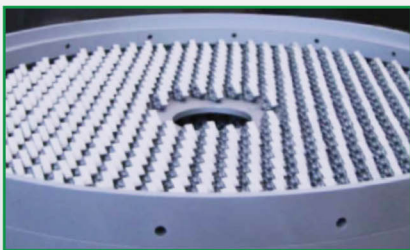
控制你的生产成本